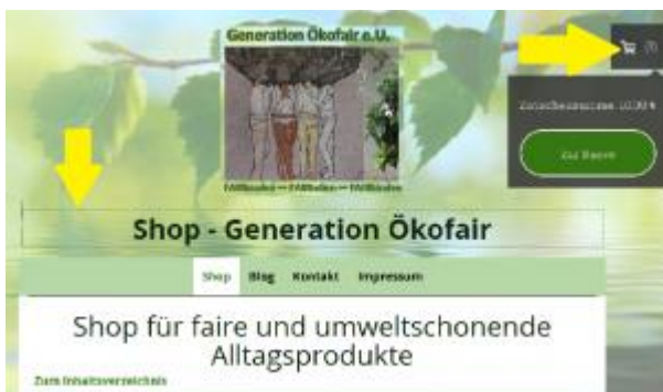
Abbildung 1: Screenshot Shop Generation Ökofair, zeigt zwei Möglichkeiten (mit Tastatur, mit Maus),