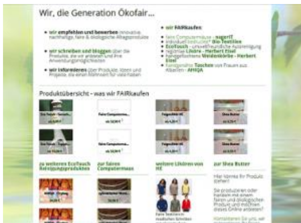
Abbildung 1: Screenshot der Startseite von www.generation-oekofair.at . Die Shop-Produkte werden in einer Produktübersicht mit Namen und Preis angezeigt.

Die Möglichkeit, eine Produktübersicht zu implementieren fand ich spitze. Da konnte ich alle unsere Produkte auf den ersten Blick präsentieren, sogar mit Produktnamen, Verlinkung zum Shop und Preis... aber leider ohne Alternativen für die Bilder.