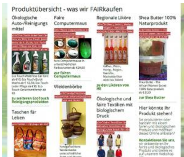
Abbildung 4: Screenshot mit angezeigten Alt-Texten der überarbeiteten Startseite von generation-oekofair.at für die barrierefreie Bereitstellung der Informationen.

Wie Sie sehen, mit etwas Kreativität kann man einige Hürden schon selbst lösen. Natürlich stehen einem nicht so viele Darstellungsmöglichkeiten zur Verfügung wie einem Webdesigner, aber ...wie finden Sie das Ergebnis??