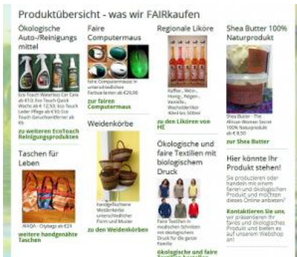
Abbildung 3: Screenshot der überarbeiteten Startseite von generation-oekofair.at für die barrierefreie Bereitstellung der Informationen.

erfreulichen Effekt, dass das Bild mit Alt-Text und Untertitel mit Richtlinie 1.1. konform ist, zusätzlich kann ich auch im Untertitel den Namen des Produktes und den Preis eingeben.